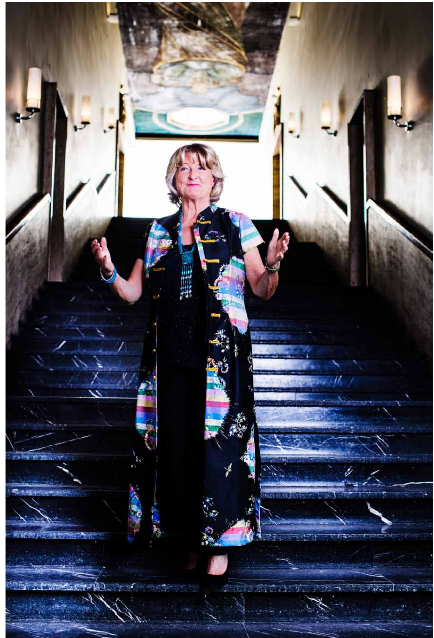
JAZZ. De har høy selvtillit, er kreative og utadvendte, sier forskerne om jazzfolket. Karin Krog gjenner seg ikke igjen. Men hun tror nok det krever litt ekstra å sette seg inn i sjangeren.