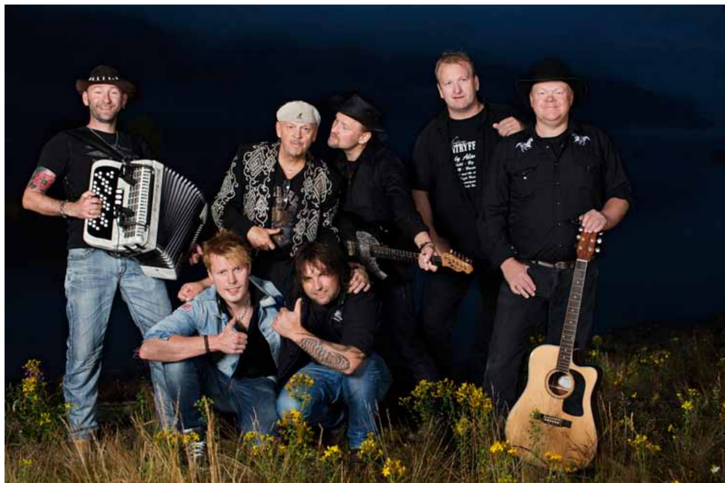
FESTCOUNTRY. Morgenandakt, serien Bonanza eller countrymusikk står alltid på radioen når Vassendgutane er ute på tur. Countryfolket liker ikke å gjøre det komplisert, viser forskning.